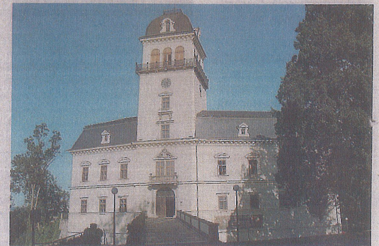
⊙ Schloss Tollet auf einer Anhöhe des Trattnachteales – vor dem Verfall gerettet.