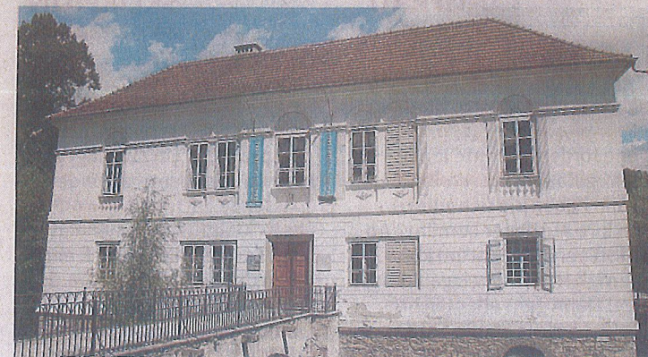
Das romantische Renaissance-Schloss Parz bei Grieskirchen