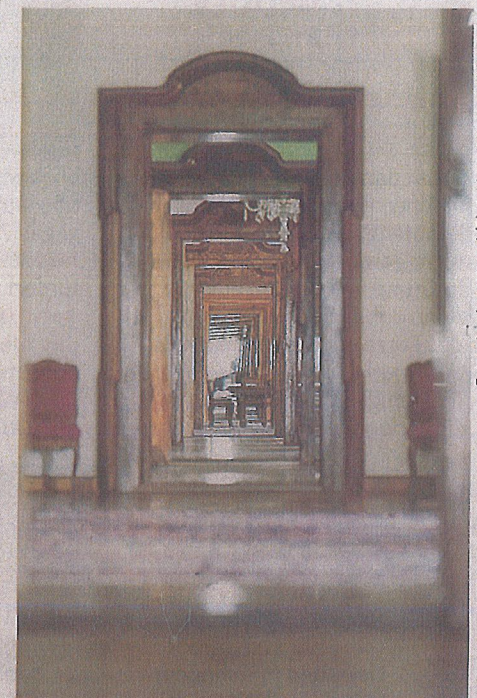
⊙ Repräsentation mit le- bendiger Geschichte von Raum zu Raum und einer Schlosskapelle in der ers- ten Etage der Tillysburg.